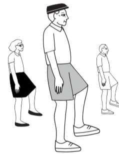
Εγγραφείτε σε πρόγραμμα