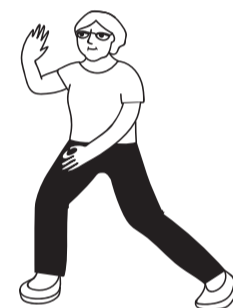
ΤΑΙ ΤΣΙ (TAI CHI)

Αντιμετωπίστε την πρόκληση, δεν πειράζει αν παραπατήσετε αρκεί να έχετε υποστήριξη!