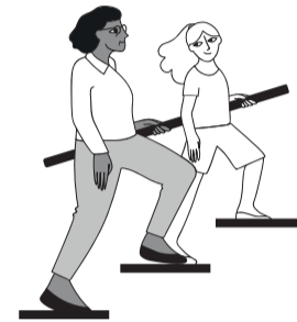
ΠΗΓΑΙΝΕΤΕ ΑΠΟ ΤΙΣ ΣΚΑΛΕΣ

Οι πτώσεις μπορεί να μειωθούν έως και κατά 40% με τις ασκήσεις δύναμης και ισορροπίας.