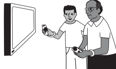
ΒΙΝΤΕΟΠΑΙΧΝΙΔΙΑ ΜΕ ΑΣΚΗΣΗ